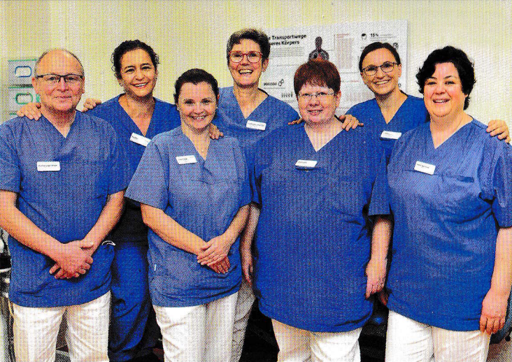
Das Team der Klinik für Gefäßchirurgie